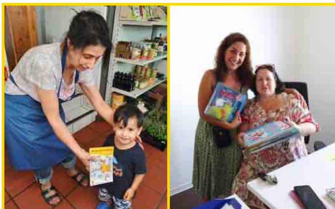
Bücherübergabe an syrische Mutter Kita Hemmingen