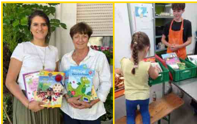
Foto (links): Frauenhaus Geisenkirchen Foto (rechts): Tübinger Tafel